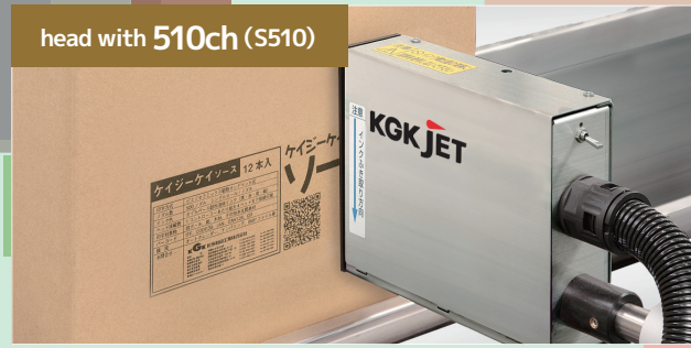
head with 510ch (S510)

▲ Realized print height of 70 mm for 180 dpi is an ideal alternative to the use of labels.