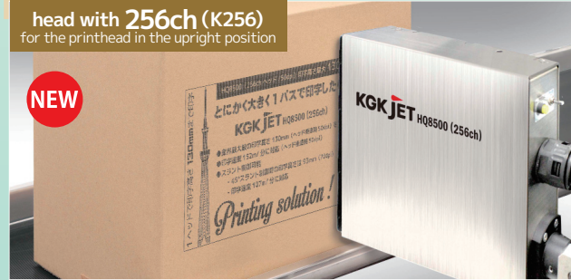
head with 256ch (K256) for the printhead in the upright position

▲ Print height of 130mm achieved with 50 dpi resolution. The industry highest. Good for printing on the styrofoam substrate