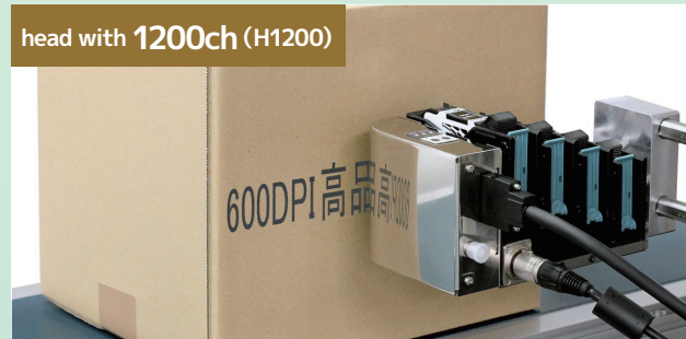
head with 1200ch (H1200)

▲ The four ink cartridges integrated with the nozzle of 12.7mm print height for 600 dpi covers the print height of 49.3mm.