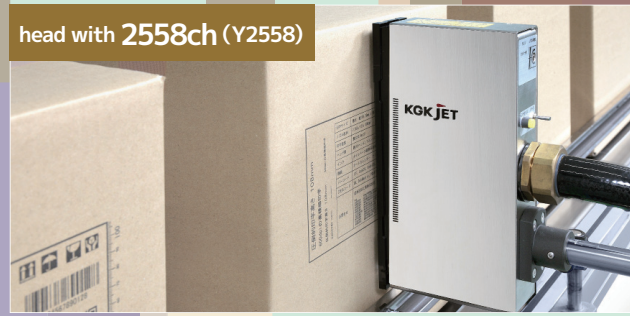
head with 2558ch (Y2558)

▲ Print height of 108mm realized – Highest level in the industry