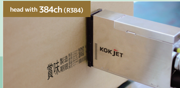
head with 384ch (R384)

▲ Suitable for printing bar code or QR code Print height 32.4mm 300dpi