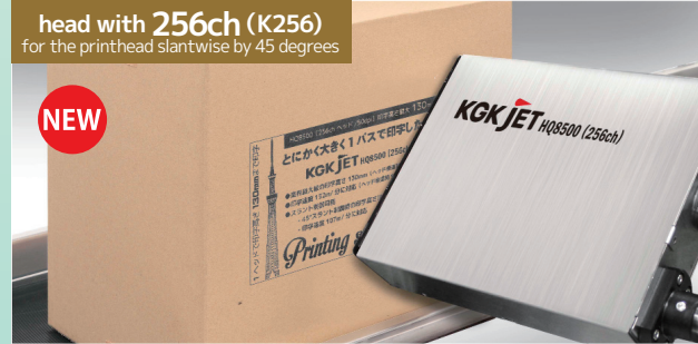
head with 256ch (K256) for the printhead slantwise by 45 degrees

▲ Print height of 93mm achieved with 70 dpi resolution. with the printhead in slantwise position.